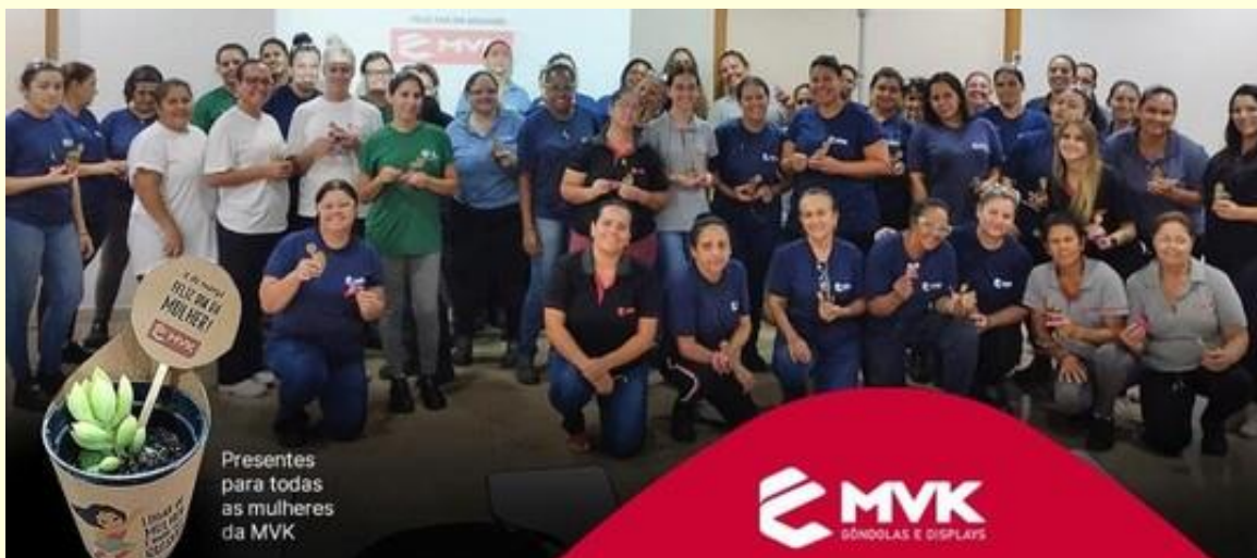
*Homenaje "Día internacional a la mujer" (08/03/2024)

Actualmente, las mujeres representan 36% de la fuerza laboral de la empresa MVK. Reconocemos la importancia de brindar igualdad de oportunidades y un ambiente inclusivo para todos nuestros empleados, y seguimos comprometidos a continuar promoviendo la diversidad y la equidad de género en la empresa.