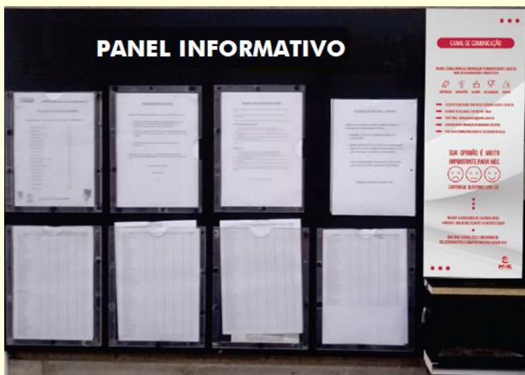
*Existen varios paneles informativos por la empresa.

No toleramos ninguna forma de acoso, ya sea sexual, moral, racial, religioso o de cualquiera naturaleza. La empresa MVK se enorgullece de ser una empresa que promueve el respeto mutuo, la dignidad y la igualdad. Para garantizar que todas las inquietudes relacionadas con el acoso se aborden de manera adecuada y efectiva, hemos establecido un canal de denuncia confidencial y seguro para nuestros empleados.